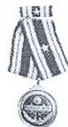
Huân chương Độc lập Hàng Ba